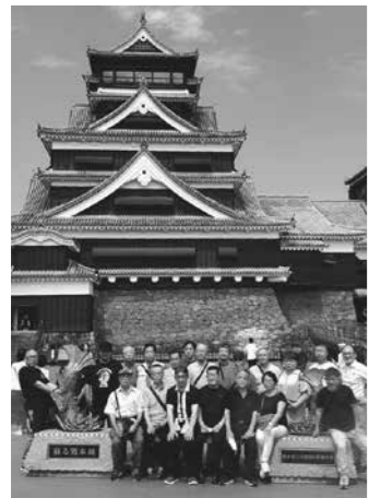
熊本大会を満喫する、ぐんま飲食メンバー