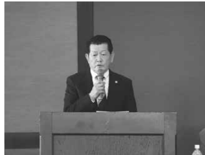
群馬県飲食業生活衛生同業組合 理事長

※組合で抱える諸問題を明確にして解決策の方向性を見出します。また、支部組合の枠を超えて共同で事業を行うことで高い効果が得られることも期待できます。組合加入の満足度アップにもつながるはず。